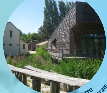
L'amphithéâtre du Moulin du Marais

Pour cela, il sera possible de choisir et créer son projet sur mesure quel que soit le niveau des enfants mais également le thème souhaité.